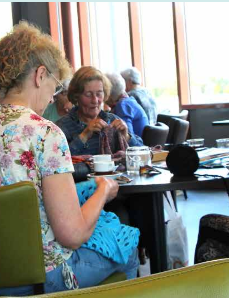
Huiskamer - Overloon

Ieder bestuurslid krijgt een eigen taak waarmee het vele bestuurswerk goed verdeeld kan worden. Verschillende bestuursfuncties moeten echter nog wel ingevuld worden. Voelt u zich geroepen laat het ons weten en nieuwe ideeën zijn natuurlijk welkom.