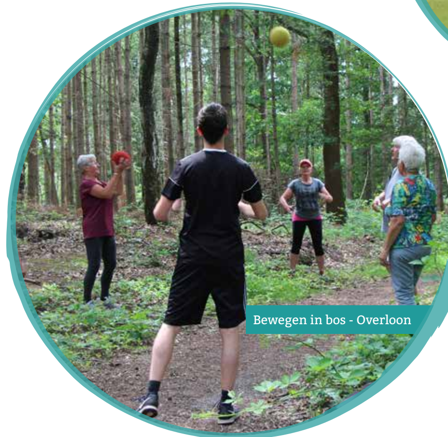
Bewegen in bos - Overloon