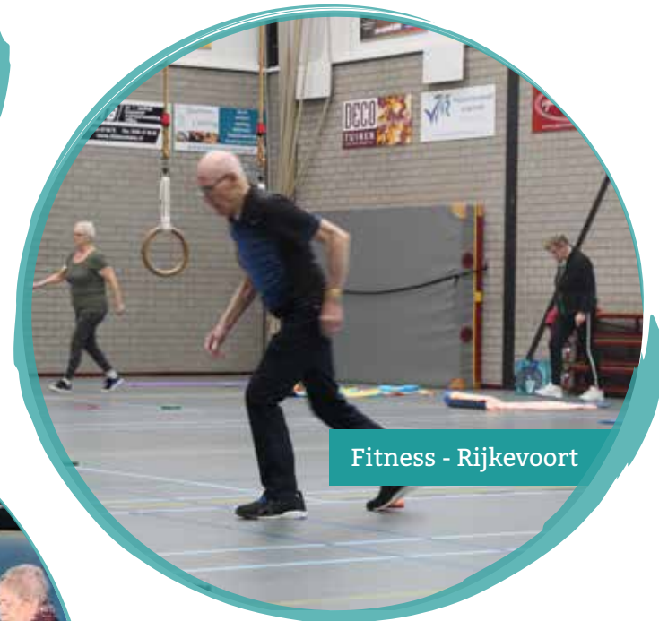
Fitness - Rijkevoort