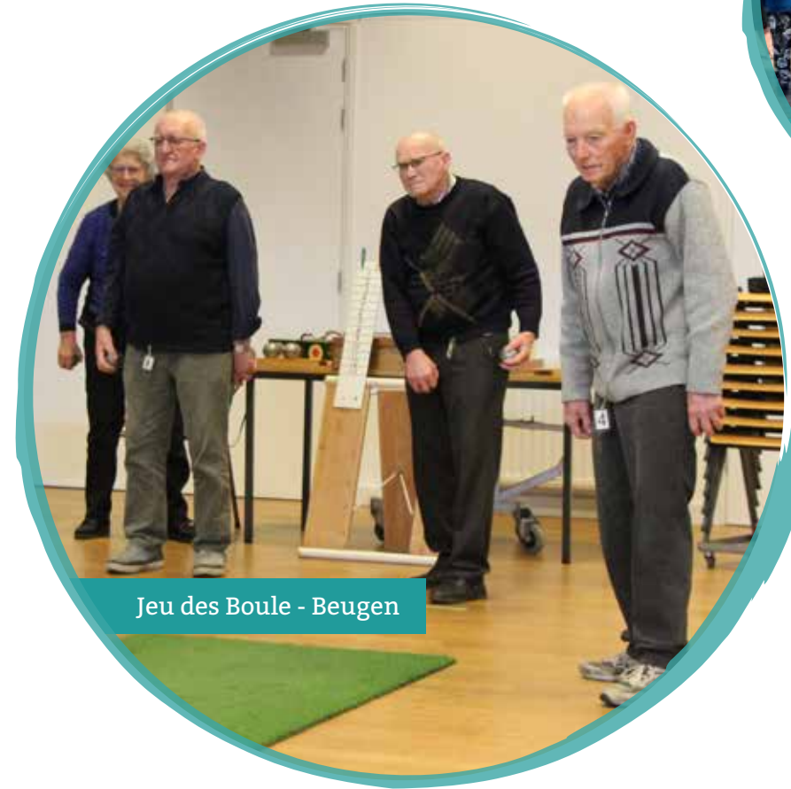
Jeu des Boule - Beugen