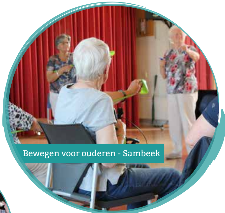
Bewegen voor ouderen - Sambeek