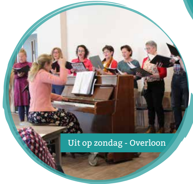
Uit op zondag - Overloon